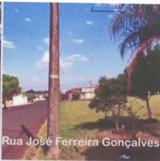
Rua José Ferreira Gonçalves