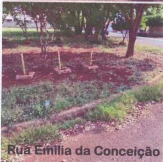
Rua Emília da Conceição