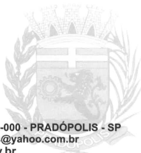
CLAIR BRONZATI Membro